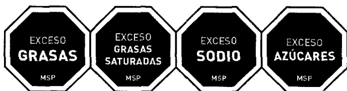
Figura 1. Diseño del rotulado frontal a ser utilizado en la cara frontal de las etiquetas.

El rotulado frontal consistirá de símbolos con diseño octagonal y fondo negro y borde blanco, que contendrán en su interior la expresión "EXCESO" seguida del nutriente que corresponda: GRASA, GRASAS SATURADAS, AZÚCARES o SODIO, según se detalla en la Figura 1. Se incluirá un símbolo por cada nutriente que se encuentre en exceso.