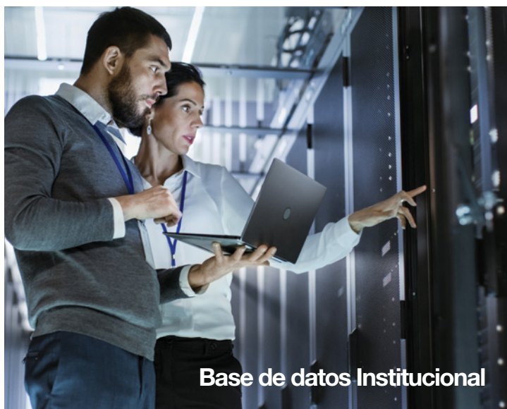
Base de datos Institucional

Y PARA CONSTANCIA y de conformidad se otorgan y firman tres ejemplares de un mismo tenor en el lugar y fecha arriba indicados.