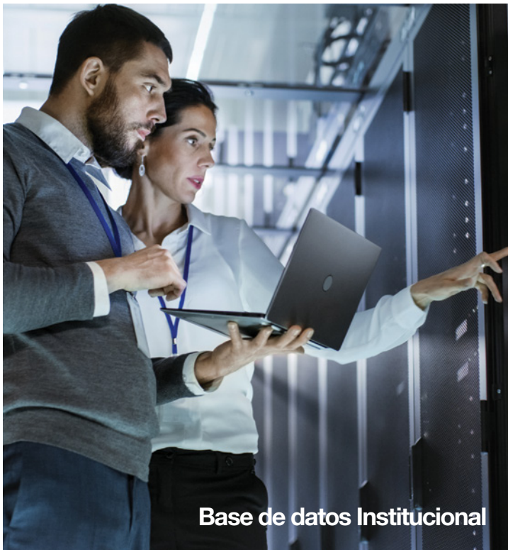
Base de datos Institucional