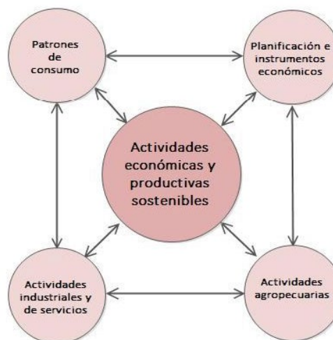
Figura 3. La dimensión de actividades económicas productivas sostenibles, con sus Objetivos Específicos.