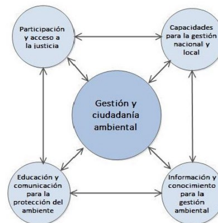
Figura 4. La dimensión de Gestión y ciudadanía ambiental, con sus Objetivos Específicos.

Apunta a fortalecer y generar ámbitos e instancias adecuadas de comunicación y participación amplia y efectiva, tanto en el sector público como en el privado, para involucrar a toda la población en el cuidado ambiental. El acceso a información pertinente, oportuna y de calidad se considera como una condición habilitante para que dicha participación pueda ser genuina y que sea tenida en cuenta en la toma de decisiones, por lo cual propenderá a atender las dimensiones de género y generaciones que condicionan su acceso y apropiación, así como la diversidad cultural y territorial de la población.