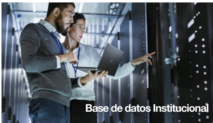
Base de datos Institucional