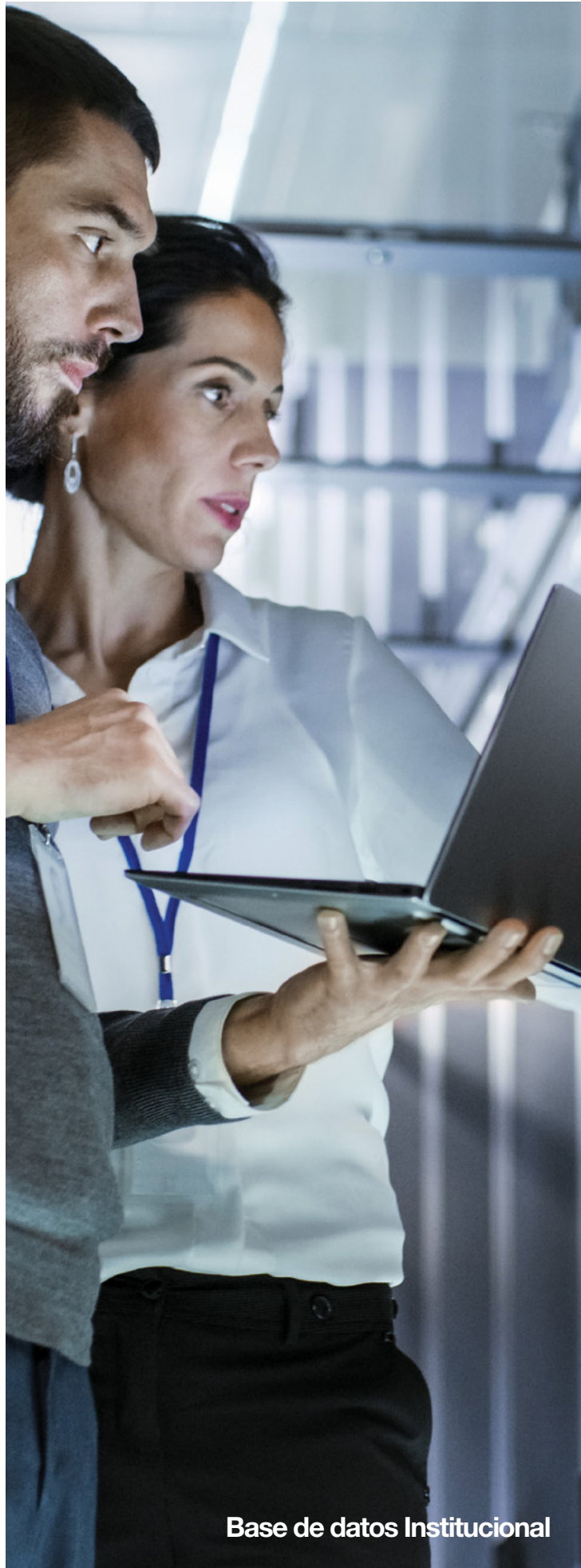
Base de datos Institucional