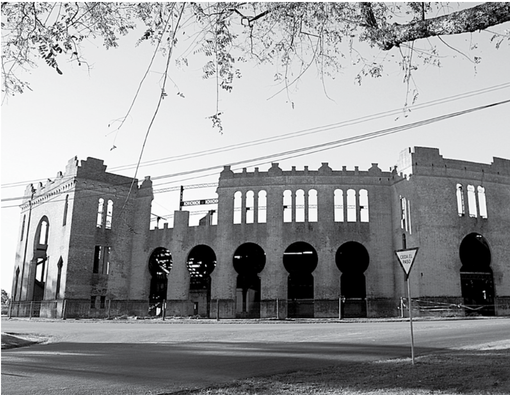
Plaza de Toros de Colonia del Sacramento, un debe a la población